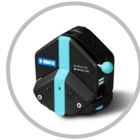
EasyPump シリーズ(圧力固定型)