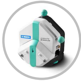
EasyPump シリーズ(圧力調整可能型)